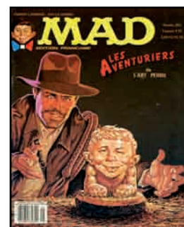
Revue bande-dessinée MAD N°5 Les aventuriers de l'art perdu coll. D. Alexandre-Bidon © DC Comics.

L'ouvrage de Heinrich Schliemann Ilios, ville et pays des Troyens : résultats des fouilles sur l'emplacement de Troie et des explorations faites en Troade de 1871 à 1882 , sera également présenté, ainsi que des photographies du Machu Picchu et d'Hiram Bingham, réalisées par Hiram Bingham et G. F. Eaton.