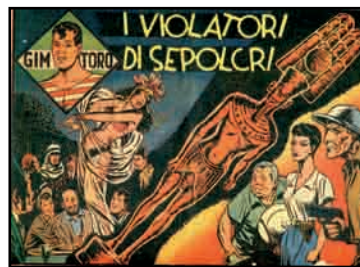
11. Album de bande dessinée Gim Toro : I violatori di sepolcri , 2 août 1947, n°17 des aventures de Gim Toro, coll. D. Alexandre-Bidon