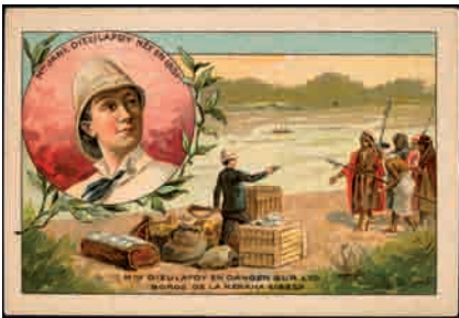
Carte publicitaire figurant « Madame Dieulafoy en danger sur les bords de la Kerkha (1885) » Carte parue dans la série « Les Explorateurs Célèbres », chromolithographie. L'ingénieur Marcel Dieulafoy (1844-1920) et son épouse Jane (1851-1916) parcourent la Perse en 1881-1882 à la recherche des origines de l'architecture. Dès 1883, le couple obtient du gouvernement persan l'autorisation de fouiller Suse, dont ils rapportent des vestiges rapidement exposés au musée du Louvre. La publication du journal de voyage (1883-1886) puis du journal des fouilles (1888) des Dieulafoy remporte un grand succès dès sa parution. Le récit de leurs expéditions relate des conditions de fouilles difficiles dans une région politiquement peu contrôlée et s'apparente ainsi au roman d'aventure. Habillée en homme et portant les cheveux courts, Jane est raillée mais fait aussi figure d'exploratrice moderne. Vers 1890-1900.

L'archéologue savant véhicule souvent dans la fiction des sous-entendus impérialistes. Affublé de son costume de couteil blanc et de son inévitable casque colonial, le savant évolue dans des contrées exotiques, au milieu d'indigènes menaçants et d'ouvriers creusant sous sa houlette. Cette image est par exemple véhiculée par le film d'aventure mais aussi par la littérature, comme dans La Romancière et l'archéologue d'Agatha Christie (1946), dans lequel sa description du chantier de Chagar Bazar en Syrie dans les années 1930 reprend certains de ces éléments.