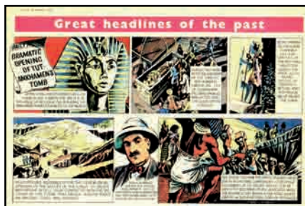
10. Planche de bande dessinée parue dans Eagle , vol. 2 n°41, 1952. Anc. coll. P. Couperie