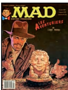
5. Bande-dessinée MAD, n°5 Les aventuriers de l'art perdu , 1982, coll. D. Alexandre-Bidon © DC Comics.