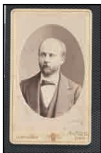
1. Portrait photographique de Gaston Camille Maspero, par Charles Reutlinger, 1883 © Bibliothèque nationale de France - Société de Géographie

Ces visuels sont utilisables exclusivement dans le cadre d'un article sur l'exposition du musée ARCHÉA : Silence, on fouille ! L'archéologie entre science et fiction. Ils doivent toujours être accompagnés de leurs légendes et crédits.