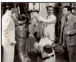
4. Photographie de plateau du film Charlie Chan en Égypte , de L. King, 1935