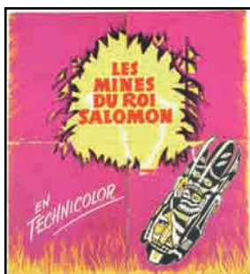
7. Manuel d'exploitation du film Les Mines du roi Salomon , MGM, 1950, coll. ARCHÉA, musée d'Archéologie en Pays de France