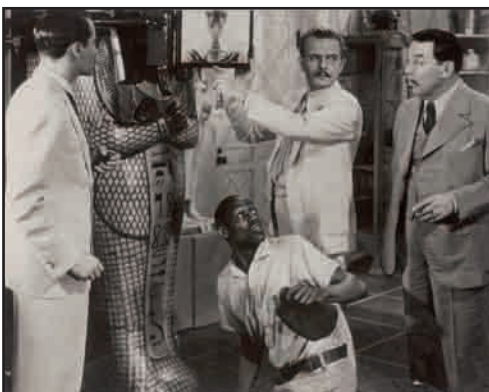
Photographie de plateau du film «Charlie Chan en Égypte» réalisé par Louis King en 1935.

Le détective américain Charlie Chan a été créé dans les années 1920 par le romancier Earl Biggers, puis décliné en bandes dessinées et en dessins animés. D'origine chinoise, il était censé représenter un modèle d'intégration dans la société américaine. Les adaptations filmées le mettent en scène dans des aventures exotiques, ici en Égypte, où il enquête pour le compte de la Société Française d'Archéologie autour des objets issus du tombeau d'Amétis. Détective archétypal, il examine ici le sarcophage à l'aide d'une loupe.