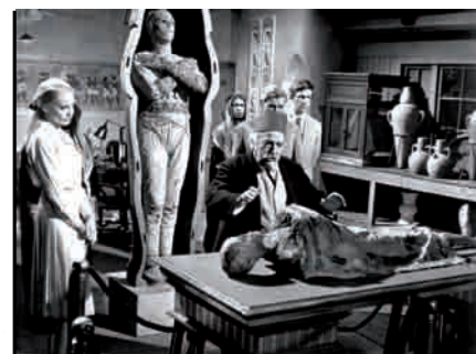
Photographie de plateau du film Dans les griffes de la momie , réalisé par John Gilling en 1966.