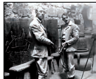
9. Photographie de plateau du film Il était une fois la Légion , de Dick Richards, 1977