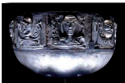
Bassin en argent dit « chaudron de Gundestrup », 2 ème siècle av. J.-C.

Ces découvertes retentissantes ont accru l'engouement pour ces civilisations disparues, décrites dans les récits des scientifiques ou par des récits romanesques. À l'issue de ses péripéties, l'archéologue aventurier fait parfois une grande révélation. De part son aptitude à résoudre les mystères du passé et sa connaissance des réponses historiques données aux questions existentielles de la mort ou de la destinée des civilisations, l'archéologue aurait, plus que nul autre être humain, accès à de profondes vérités.