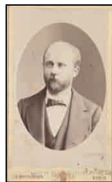
Portrait de Gaston Camille Maspero - par Charles Reutlinger - 1883

Il apparaît également comme un personnage complètement voué à son métier. Dans son ouvrage Le Roman de la momie , paru en 1858, Théophile Gautier dresse déjà le profil de l'archéologue savant à travers le personnage du docteur Rumphius, « égyptologue vêtu avec une négligence scientifique d'un habit noir et d'une cravate de mousseline ». Le savant de fiction est généralement un professeur âgé, barbu, chaussant des lunettes, vêtu d'un costume et d'un nœud papillon, à l'instar du célèbre professeur Henry Jones dans la série des Indiana Jones .