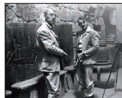
Photographie de plateau du film Il était une fois la légion, de Dick Richards, 1977

Un montage audiovisuel illustre ces thèmes par des extraits de La Malédiction des pharaons de Terence Fisher (1959), ou encore Il était une fois la Légion de Dick Richards (1977). Seront également visibles des extraits de La Planète des singes de Franklin J. Schaffner (1968), et de L'Exorciste de William Friedkin (1973).