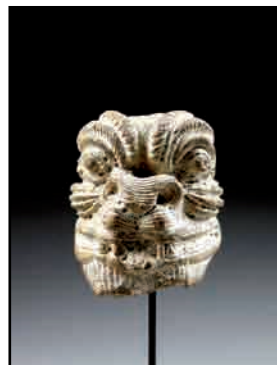
13. Tête du démon assyrien Pazuzu, provenant de la région de Mossoul, Irak. Première moitié du I er millénaire av. J.-C. Terre cuite. Paris, Musée du Louvre, Département des Antiquités Orientales