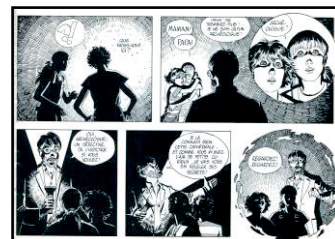
3. Vignettes de la bande dessinée Le Secret de la cathédrale , 1981, coll. D. Alexandre-Bidon © Jean Pénichon - Léon Wisznia - André Juillard - DR.