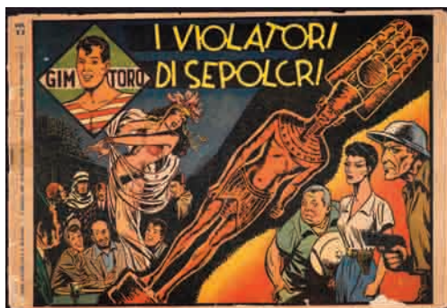
Album de bande dessinée : Gim Toro I violatori di sepolcri , 2 août 1947, n°17 des aventures de Gim Toro, coll. D. Alexandre-Bidon