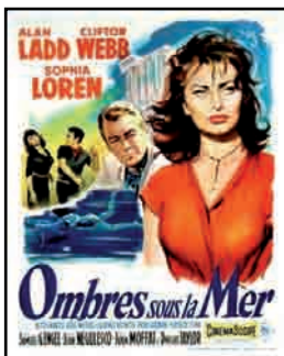
8. Affiche du film Ombres sous la mer , par Rinaldo Geleng, 1957, Bibliothèque Forney © Rinaldo Geleng - Parisienne de photographie