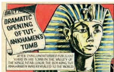
Détail - Planche de bande dessinée parue dans Eagle , vol. 2 n°41, 1952. Anc. coll. P. Couperie

Derrière ces apparences positives, la pratique archéologique dérange à plusieurs titres. La proximité de l'archéo-anthropologue avec la mort qui peut notamment fasciner mais aussi étonner et déranger.