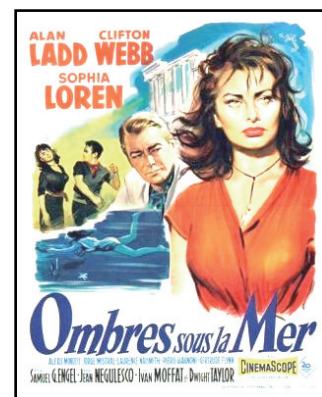
Affiche du film Ombres sous la mer - 1959 - Fox Bibliothèque Forney

Un montage audiovisuel montre que l'archéologie sous-marine oscille souvent entre fiction et documentaire scientifique, avec des extraits de La Vénus des mers chaudes ( Underwater , de John Sturges, 1955) ou encore des extraits de journaux télévisés montrant des découvertes d'épaves.