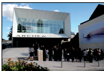
14. ARCHÉA © Roissy Porte de France - Architecture : Agence Bruno Pantz

Des visuels supplémentaires sont disponibles sur demande auprès de l'Agence Catherine Dantan : marc@catherine-dantan.fr Tél. 01 40 21 05 15