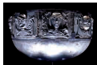
6. Bassin en argent dit «chaudron de Gundestrup», 2 ème siècle av. J.-C.