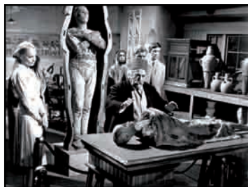
12. Photographie de plateau du film Dans les griffes de la momie , de John Gilling, 1966